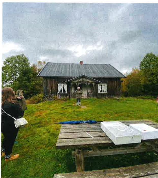
Abborhøgda – Kongsvinger kommune

Felles for alle 3 prioriteringsområdene – forurensning, biologiske mangfold/kulturlandskap og kulturminner og kulturmiljøer, inkl. bygninger gjelder at planleggings og tilretteleggingsprosjekter kan støttes med inntil 100 % tilskudd. F.eks prosjektering av større hydrotekniske anlegg, tilstandsrapport og restaureringsplan for kulturminner mm vil kunne falle inn under fellesposten ovenfor.