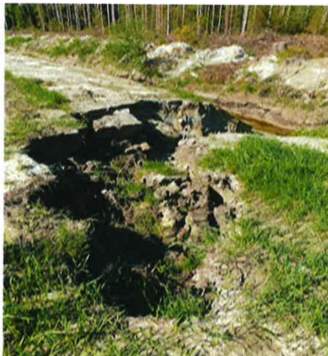
Graving rundt utløp på drensør.